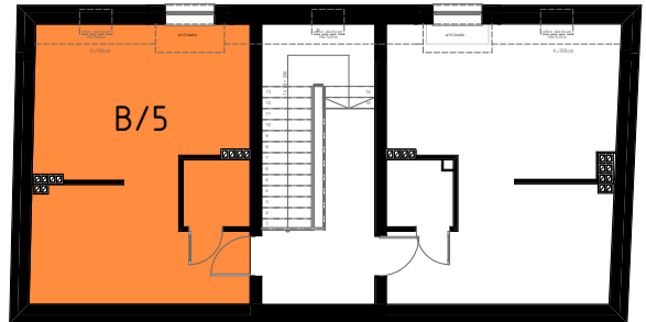
RZUT II PIĘTRA - LOKALIZACJA MIESZKANIA B/5